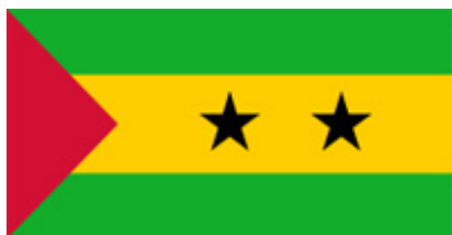
SAO TOME ET PRINCIPE

Ambassade de la République de Roumanie Rua Ramalho Ortigão, n° 30 - Bairro Alvalade - Luanda Tél.: 222 321 076 / 222 232 234