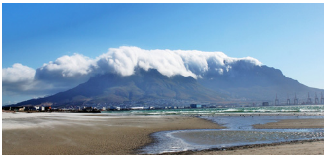
Le fameux «waterfront»